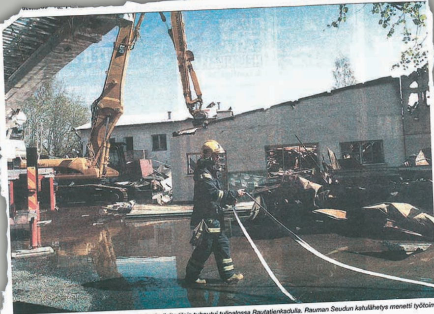
Tuhopoltto. Pienrytysten ja yhdistysten käytössä olevia tiloja tuhoutui tulipalossa Rautatienkadulla. Rauman Seudun katulähetys menetti työtoimintatilat. Vielä ei osata arvioida, kuinka suuret taloudelliset menetykset palosta koitui.